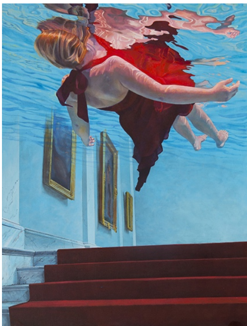
Ivana Zivic-Le Musée-2016-huile sur toile-150x115 cm

Les espaces qui apparaissent dans les peintures d'Ivana Živić, présentées pour la première fois au public parisien, représentent des salles et des palais que nous connaissons tous, comme le château du Spitzer à Beočin, le château de Versailles à Paris ou encore des salles de musée, comme celle du Louvre. L'espace est réaliste, mais l'artiste le mystifie, en faisant un espace de notre mémoire, un espace qui nous ramène aux événements et aux sentiments vécus. L'intérieur de l'âme et de la mémoire sur les toiles d'Ivana Živić est rempli d'eau qui fait vibrer la lumière, mettant l'accent sur nos émotions, nos souvenirs et nos rêves que nous recherchons.