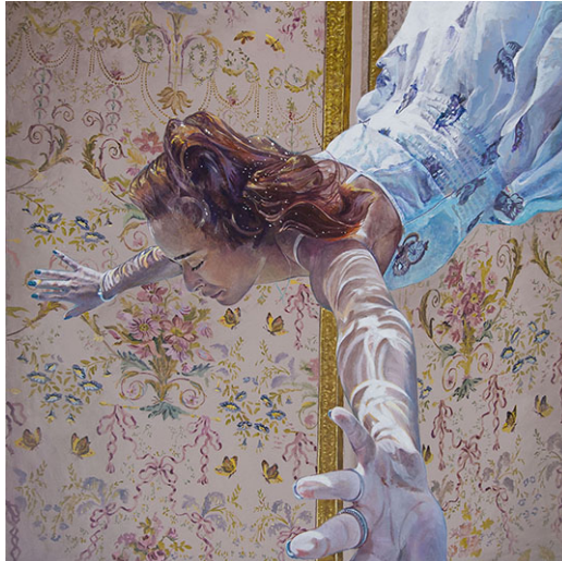
Ivana Zivic-La Chambre-2020-huile sur toile-100x100cm

Du lundi au vendredi 11h-19h et le samedi de 14h à 18h